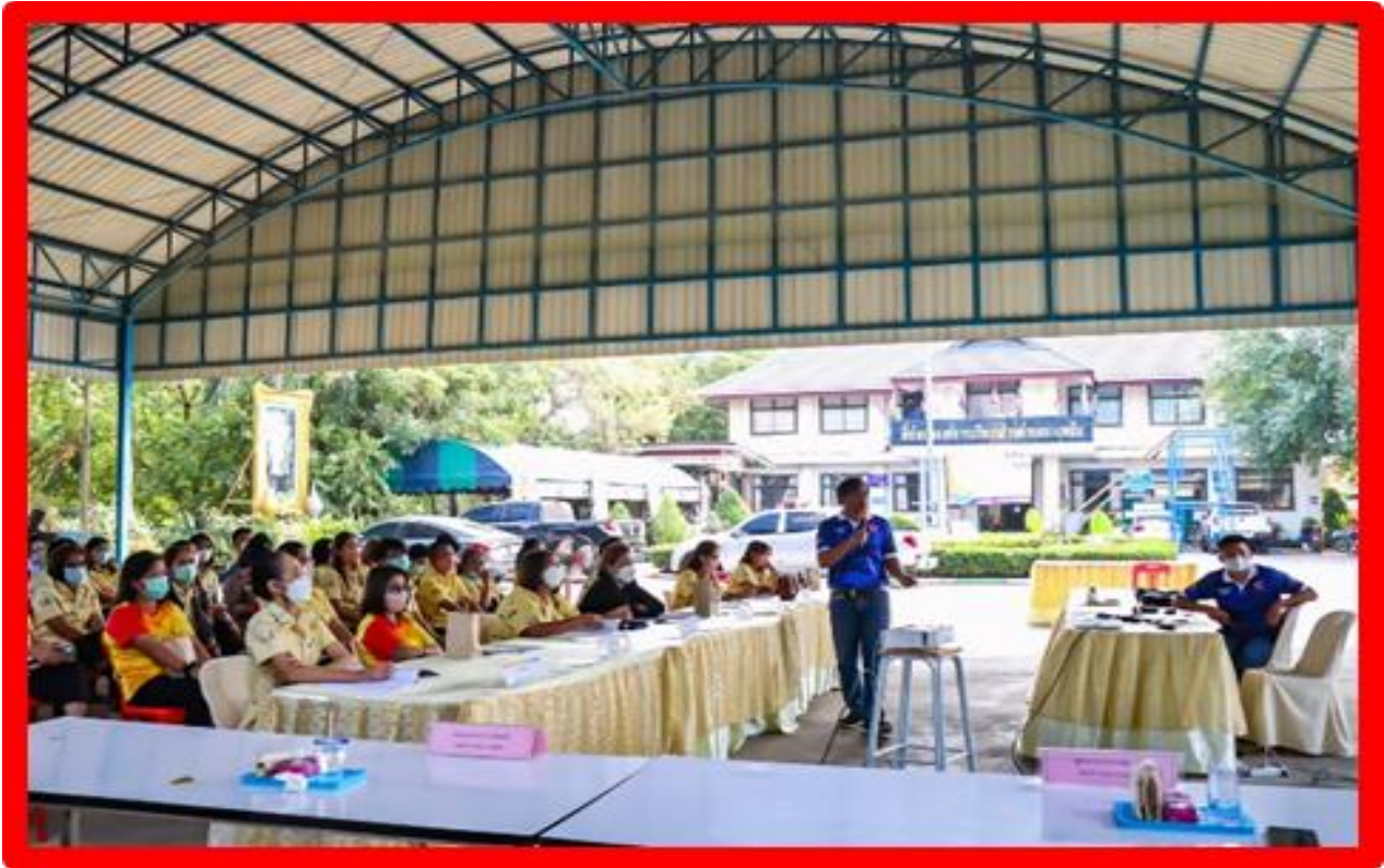
โครงการลดขยะ ลดโลกร้อน ใส่ใจสิ่งแวดล้อม